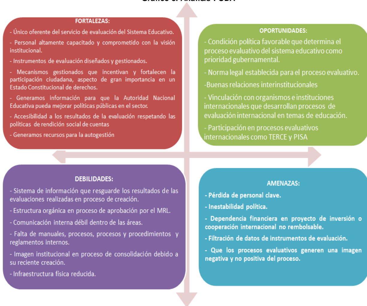
Gráfico 3. Análisis FODA