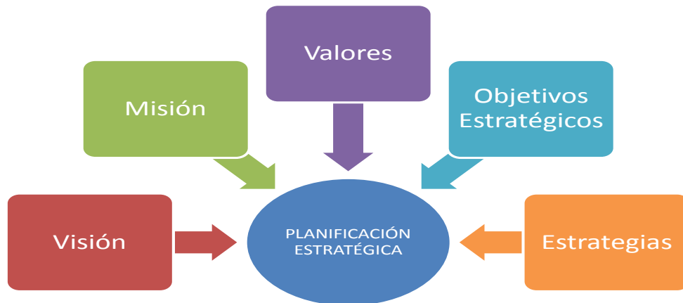
Gráfico 4. Elementos orientadores

El modelo determinado para la planificación estratégica contiene los siguientes elementos: