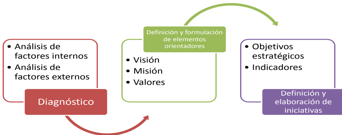
Gráfico 1. Metodología de planificación

El proceso se lo puede definir de la siguiente manera: