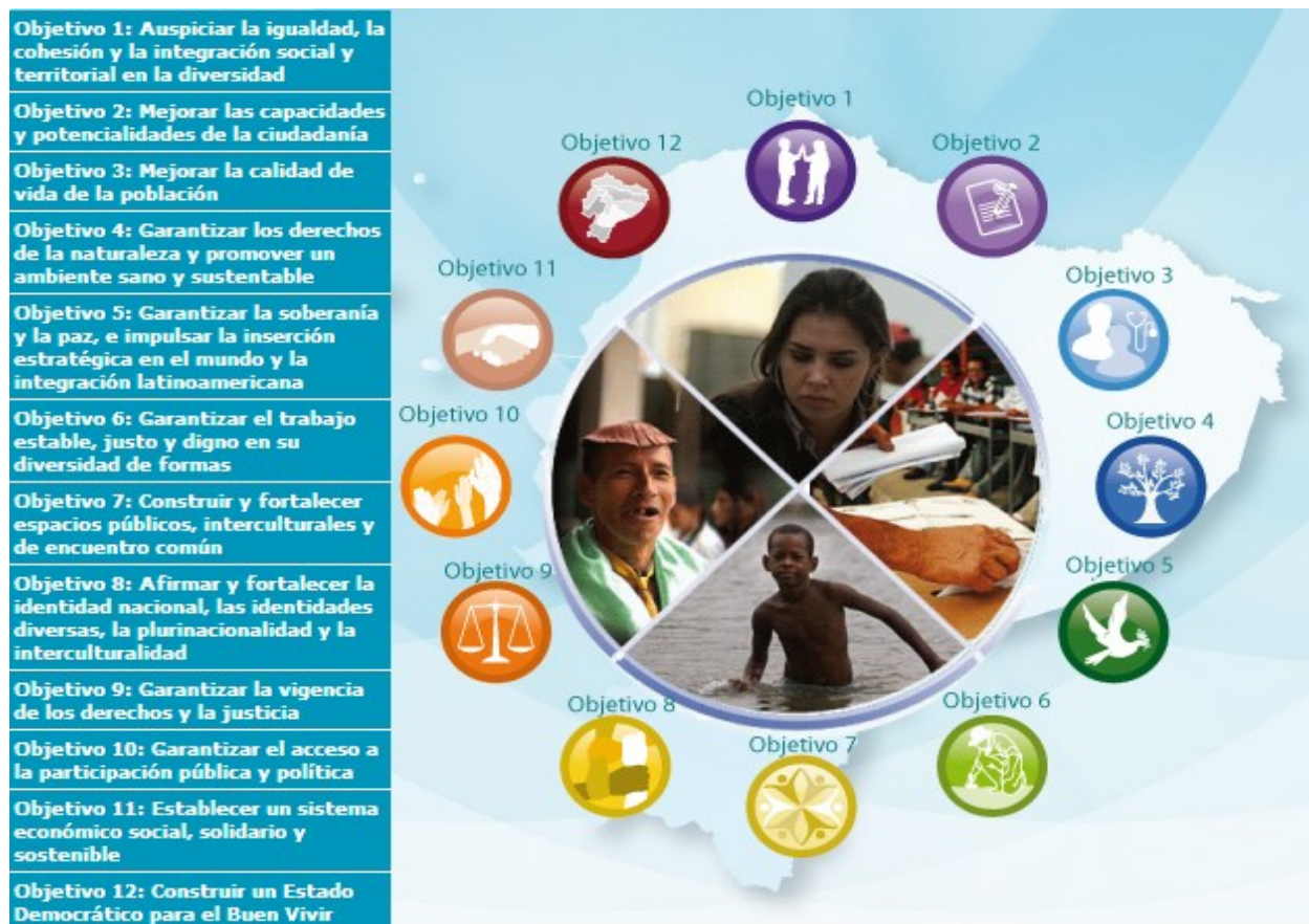
Gráfico 2. Objetivos del Plan Nacional del Buen Vivir