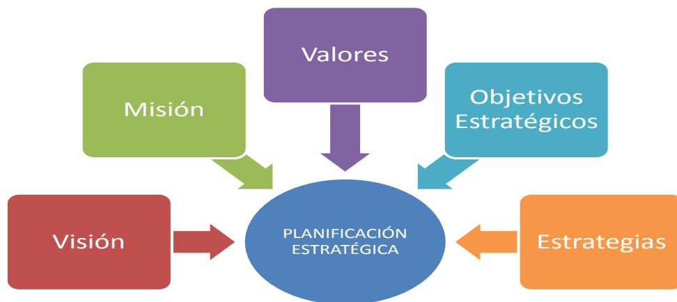
Gráfico 4. Elementos orientadores

El modelo determinado para la planificación estratégica contiene los siguientes elementos: