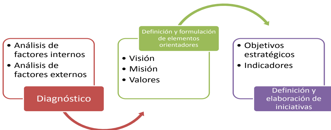
Gráfico 1. Metodología de planificación

El proceso se lo puede definir de la siguiente manera: